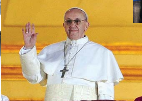
Novoizvoljeni papež Frančišek